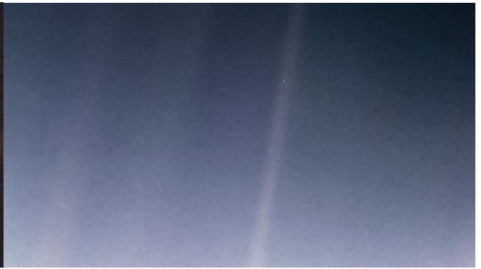
le cliché de 1990 de la sonde Voyager I